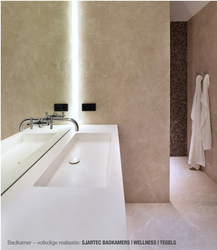
Badkamer – volledige realisatie: SJARTEC BADKAMERS | WELLNESS | TEGELS