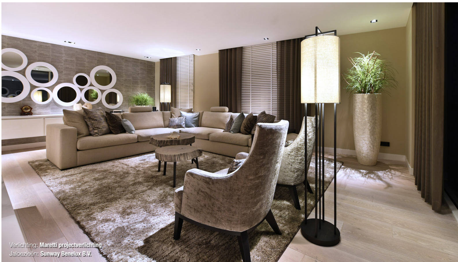
Verlichting: Maretti projectverlichting Jaloezieën: Sunway Benelux B.V.