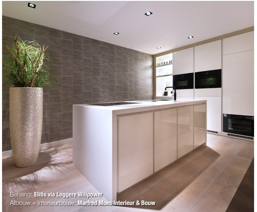
Behang: Elitis via Loggere Willpower Afbouw + Interieurbouw: Marfred Moes Interieur & Bouw