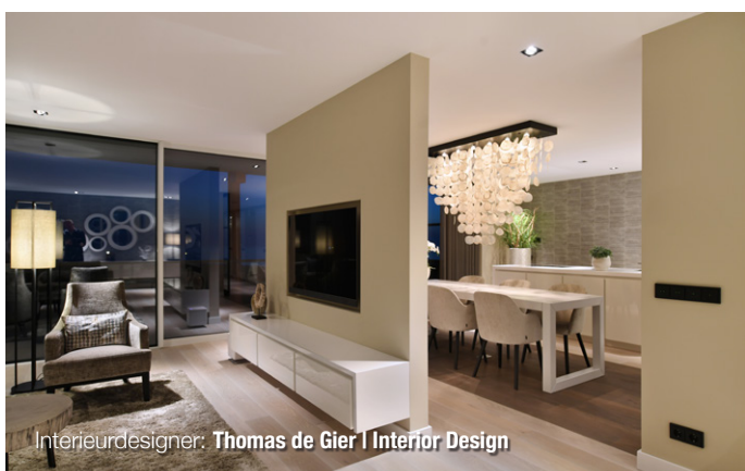
Interieurdesigner: Thomas de Gier | Interior Design